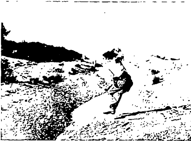
Une aventure de Billy le Kid (Jean-Pierre Léaud).